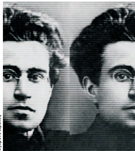
Για τον Γκράμσι και το Σύγχρονο Κράτος